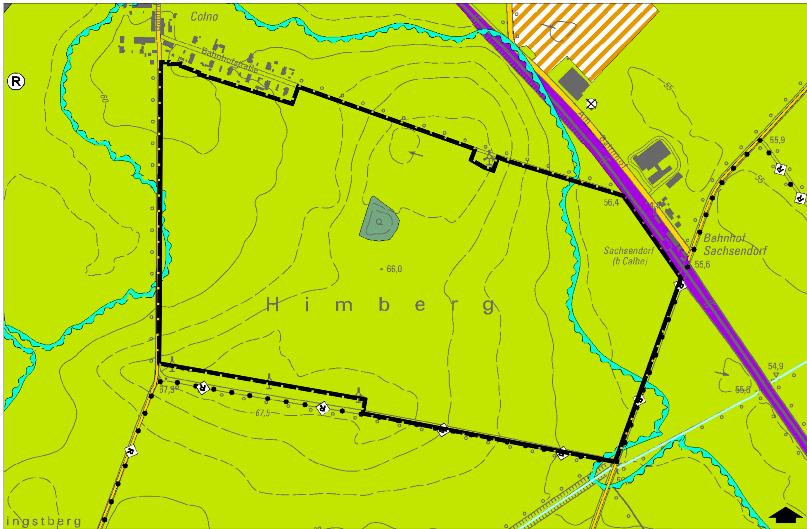
Kartengrundlage: Flächennutzungsplan, digitale Fassung