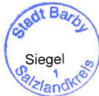
Torsten Reinharz Bürgermeister