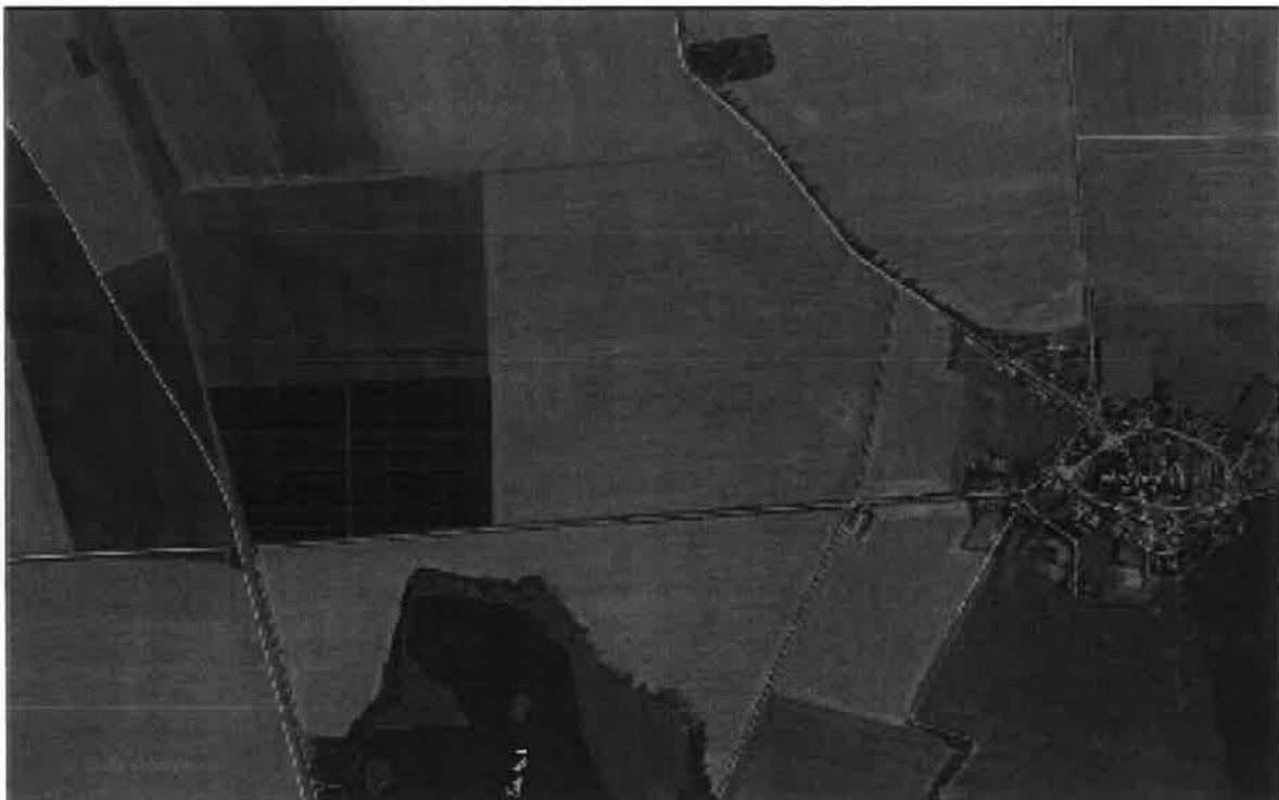
Simulation INNOVAR Solar GmbH

Das Plangebiet umfasst das folgende dargestellte Gebiet: